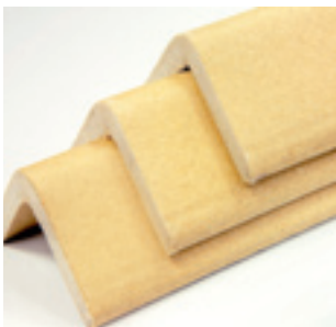
Protección de los bordes