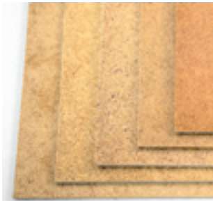
Planchas de fibra dura